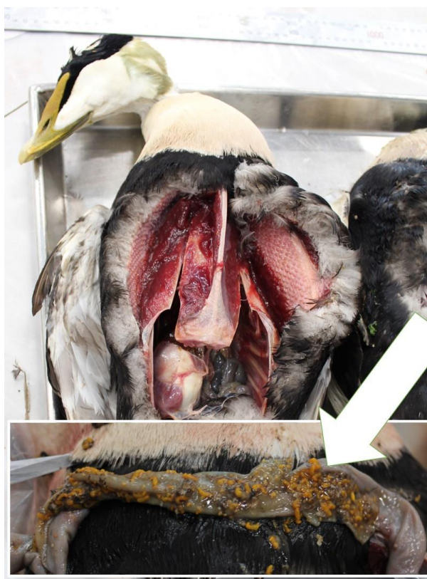
Figur 6. Stærkt afmagret edderfugl med utallige kradsere (pil) medførende tarmbetændelse.

En anden knopsvane var død som følge af svampeinfektion i lunger og luftsække.