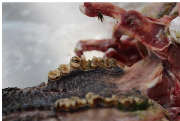
Figur 7. Slidte tænder hos rådyr.

Udover akut grutforgiftning kan fodring af rådyr medføre fordøjelsesforstyrrelse, som kan resultere i diarre og afmagring. Når rådyr tilbydes fodring med kulhydratholdige fodermidler som f.eks. majs, hvede, byg og rug, kan vommens miljø ændres markant. Vomfloraen (mikroorganismer som hjælper med omsætningen af foderet) ændrer karakter, idet den fra at være alsidig bliver domineret af en eller nogle få arter. Herved ændres vomfordøjelsen drastisk med alvorlige fordøjelsesforstyrrelser til følge, da der opstår sur vom. Dyret kan i forgiftningsfasen virke, som om det er beruset og vakler rundt.