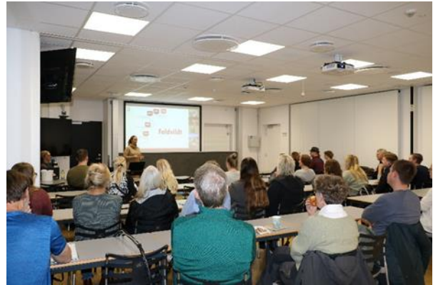
Figur 1. Foredrag til temadag om faldvildt på AAU.