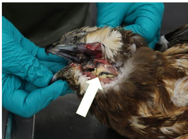
Figur 3. Rørhøg forgiftet med carbofuran. Kødlunser indeholdende giften ses i svelget (pil).

De to rørhøge blev indsendt sammen af politiet sammen med rester af en hønsefugl. Politiet havde mistanke om, at der var tale om forgiftning af rørhøgene, og at hønsefulgen havde været opsat som madding (Figur 3). Der blev givet dispensation til, at vi kunne beholde disse fugle til undersøgelse i stedet for at sende dem videre til undersøgelse for AI, selv om de blev modtaget i en periode med høj risiko for AI. Mistanken kunne opretholdes, da begge rørhøge og hønsefulgen indeholdt giftstoffet carbofuran. Carbofuran er et pesticid, der virker som nervegift og medførende lammelser og død. Det har været forbudt i EU siden 2008.