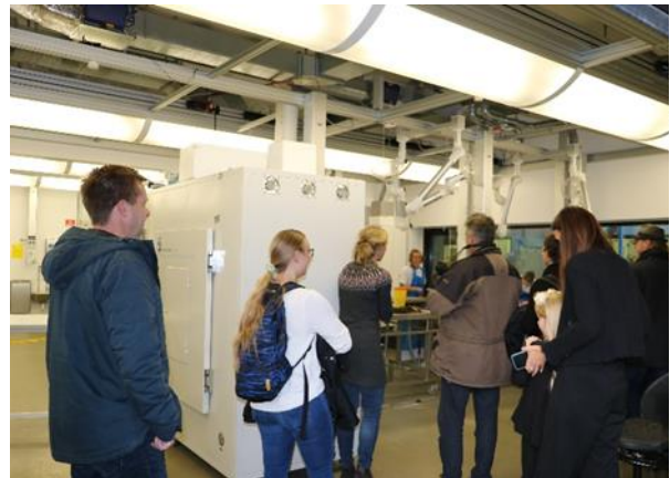
Figur 2. Obduktion for publikum til temadag om faldvildt på AAU.