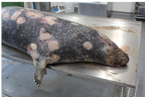
Figur 10. Spættet sæl med massive hudforandringer på store dele af kroppen.

En afmagret voksen han af spættet sæl havde udtalt hudforandringer på store dele af kroppen af uvis årsag (Figur 10), dog testede sælen positiv for højpatogent aviær influenzavirus (H5N8) ved undersøgelse på SSI. Dette anses for at være dødsårsagen, men vanskeligt at bedømme, da kadaveret var i betydeligt henfald. Det er velkendt, at sæler kan inficeres med influenzavirus. Denne sæl er den eneste positive ud af ca. 100 sæler, som er undersøgt for influenzavirus de seneste 2-3 år.