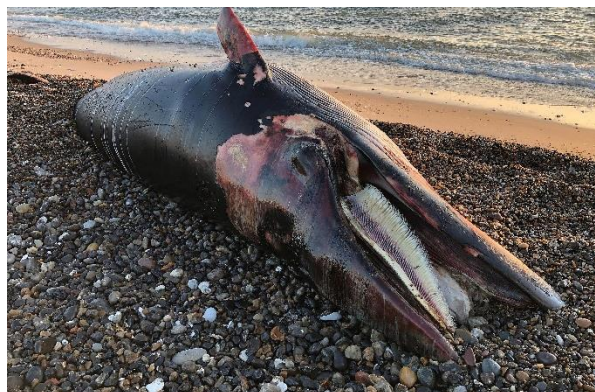
Figur 11. Strandet vågehval.

Den 9. juni 2021 strandede en vågehval ved Thorsminde (Figur 11). Vågehvalen var en ung, ikke-kønsmoden han med et stangmål på 430 cm. Hvalen var meget rådden, da den blev fundet, og derfor svær at undersøge. Dog fandtes det at den højst sandsynlig var druknet, da den havde tydelige skader i huden med friske blødninger og snørefure om halen.