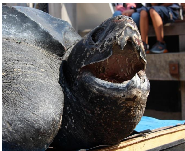
Figur 12.: Hoved af læderskildpadden strandet ved Ballum.

I november 2020 strandede en læderskildpadde på kysten ud for Ballum (Figur 12).