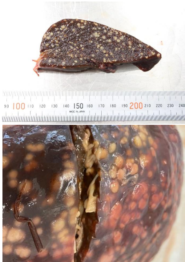
Figur 8. Lever fra rådyr med leverbetændelse. Leveren var inficeret med bakterien Yersinia pseudotuberculosis og gennemsået med bylder.

pseudotuberculosis . Hos to rådyr var bakterien årsag til leverbetændelse (Figur 8), mens den hos den tredje var årsag til blodforgiftning. Bakterien ses sporadisk som årsag til dødsfald blandt vildt, især harer. Smitten sker ved optagelse af bakterien via mavetarmkanalen. Sygdommen kan nogle gange forårsage små lokale udbrud med flere døde rådyr.