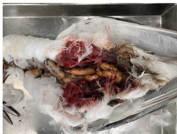
Figur 5. Mågen fra Figur 4 ses her med en del pølser i maven.

En dødfundet mosehornugle blev indsendt med mistanke om forgiftning, da den var fundet i et område, hvor der tidligere var blevet forgiftet rovfugle. Ventriklen var dog tom, så det var ikke muligt at undersøge, om ugle havde indtaget gift. Dog sås ingen blødninger fra organerne, hvilket ofte ville være tilfældet, hvis den havde ædt mus, som var døde af musegift. Uglen var dog ekstremt afmagret, men det var ikke muligt at bestemme årsagen hertil. En afmagret natugle uegnet til obduktion blev også modtaget. Natuglen var rådden og indtørret og organerne kunne derfor ikke undersøges. Dog sås det, at maveindholdet bestod af mus.