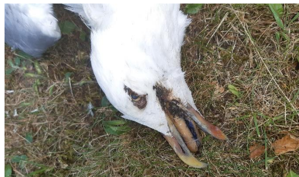
Figur 4. Måge fundet død med forgiftet pølse i næbet.

Forgiftningsundersøgelse af musvågen er endnu ikke afsluttet.